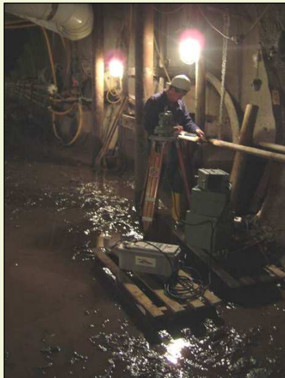
Kreisel Gi-B 3 (MOM) im untertägigen Einsatz